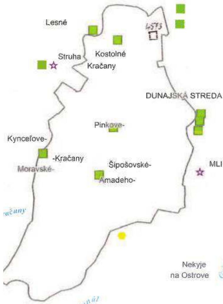
KOSTOLNÉ KRAČANY - radónové riziko